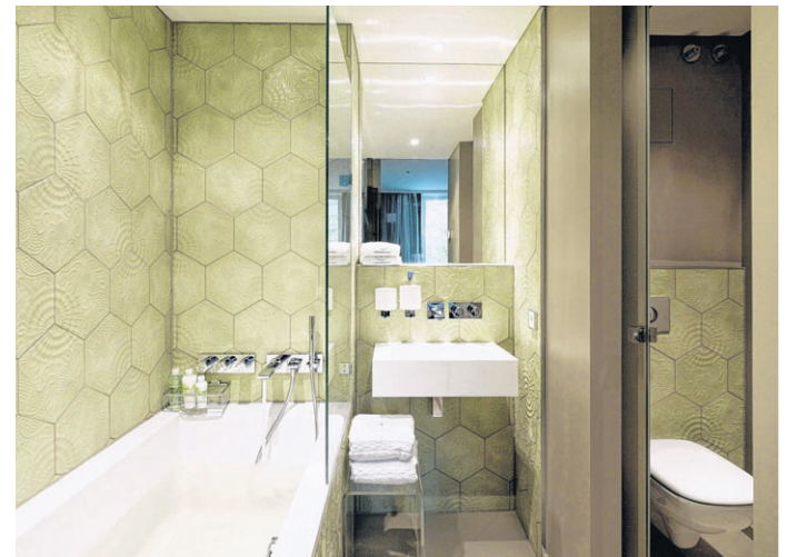
Grüne Mosaikplatten, Glasschiebetüren und Plexiglas-Elemente verleihen den Wohnungen im Stil „LED – Sophisticated Elegance“ innovativen, modernen Kontrast.

Für sich spricht die Lage der „Visionapartments“ mitten in Berlin. Die nahe gelegenen S- und U-Bahn-, Bus- sowie Straßenbahnstationen sorgen für eine ideale Verkehrsanbindung und bringen die Mieter in wenigen Minuten ans Ziel. Bis zum Hauptbahnhof sind es rund zehn Minuten. Die beiden Berliner