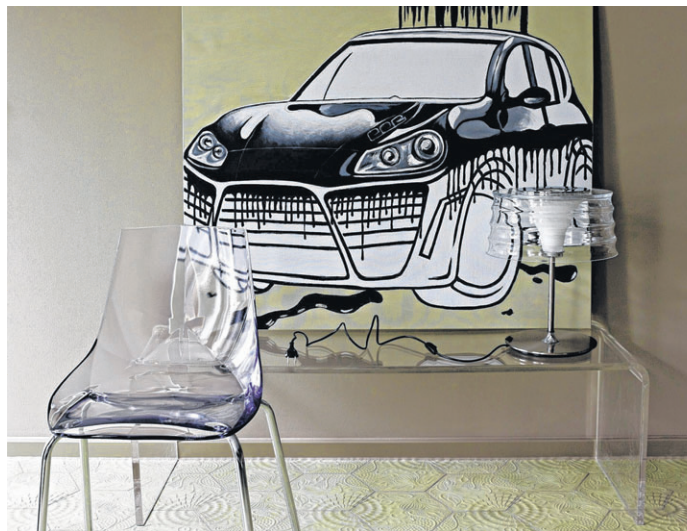
Futuristisch und etwas unerwartet präsentieren sich die topmodernen Designerwohnungen im LED-Stil von „Visionapartments“ Berlin. Schillernde Transparenz trifft hier auf blasse Naturtöne.

Flughäfen sind in gut 30 Minuten erreichbar. In Planung sind zusätzlich ein Restaurant, eine VIP-Lounge sowie ein Fitnessraum mit Wellnessbereich. Im Erdgeschoss wird bald ein Geschäft Mobilbar, Wohnaccessoires und Geschenkideen von „Visiondesign“ anbieten. Bis die öffentlichen Bereiche fertig gestellt sind, bietet das Apartmenthaus mittels Kooperation mit einem Lieferservice sogar frisches und gesundes Essen.